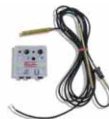
optisches und akustisches Leckagewarngerät