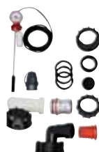
Befüllkit 1500 l, Füllstandsuhr