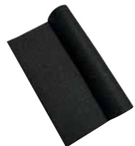
Roth Antirutschmatte: Sicherheit bei Erdbeben