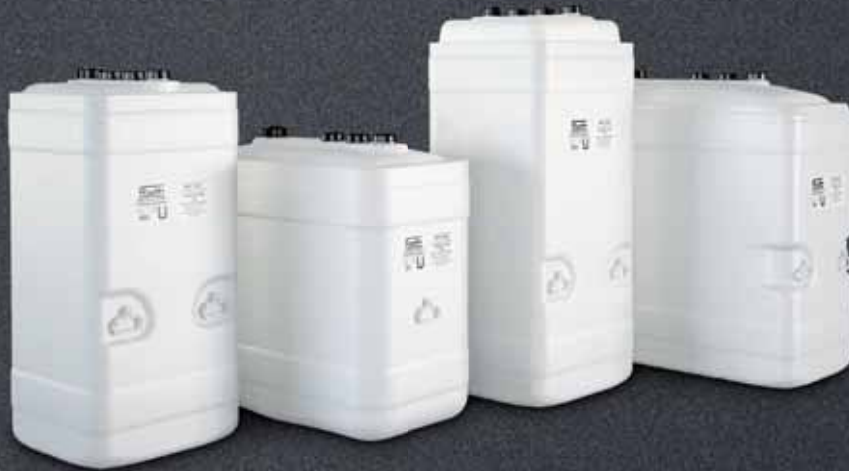
Roth KWT: 750 l-C, 1000 l-R, 1000 l-C, 1500 l-R