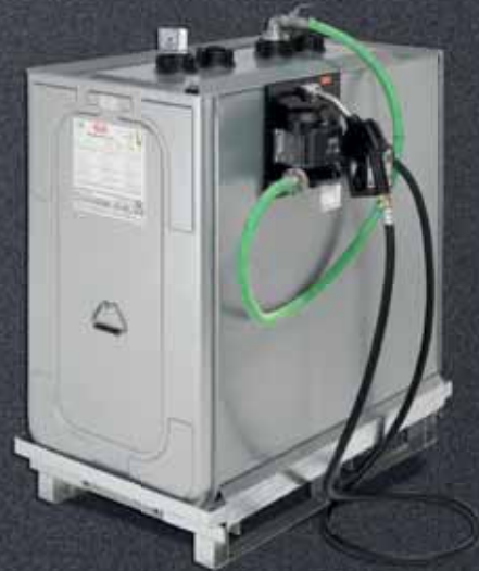
Roth Multitech-Behälter mit Pumpenset