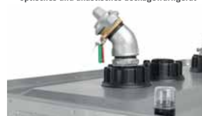
Saugrohr mit Tankwagenkupplung