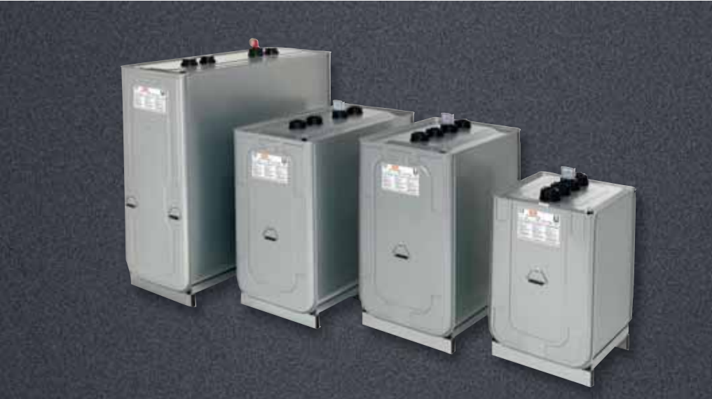
Roth Unitech 400 l, 750 l, 1000 l und 1500 l