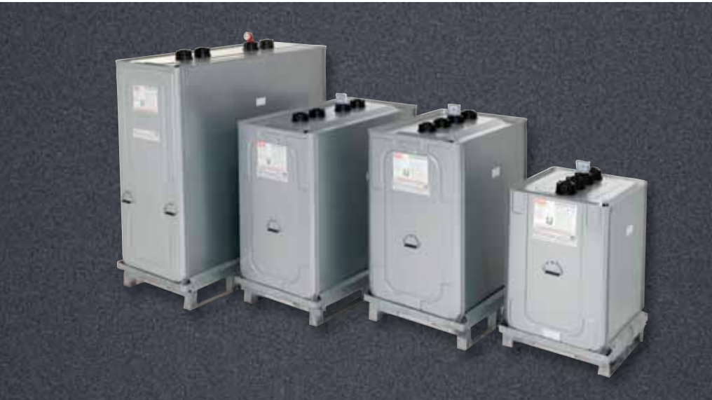
Roth Multitech 400 l, 750 l, 1000 l und 1500 l