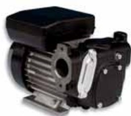
Dieselpumpe 56 l

Die Pumpe kann sowohl an dem Roth Unitech (Lagerbehälter) als auch an dem Roth Multitech (Lager- und Transportbehälter)* montiert werden.