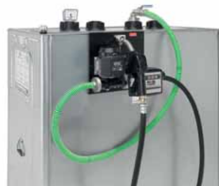
Roth Multitech-Behälter mit Dieselpumpe