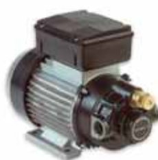
Ölpumpe 25 l