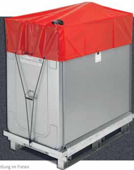
vorübergehende Aufstellung im Freien