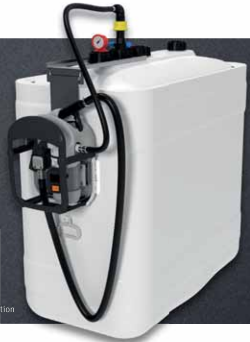
Roth GetBlue Station

Die Roth GetBlue Station kombiniert das sichere und doppelwandige Lagern von reinen Harnstofflösungen (32,5 %) mit einer komfortablen Lösung der Fahrzeugbetankung. Mit seiner Doppelwandigkeit erfüllt der Roth KWT 1000 I-R alle Voraussetzungen zur Lagerung von Harnstofflösung (z. B. AdBlue*). Der Wannenrand schließt nach innen direkt an den Tank an, sodass funktional eine Tankeinheit entsteht. Der Dieselsatzstoff der Wassergefährdungsklasse 1 (WGK 1) ist für den Roth KWT 1000 I-R zugelassen (AbZ Z-40.21-319**) und optimal geschützt.