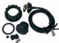
Entnahme- und Belüftungskit für Einzeltank